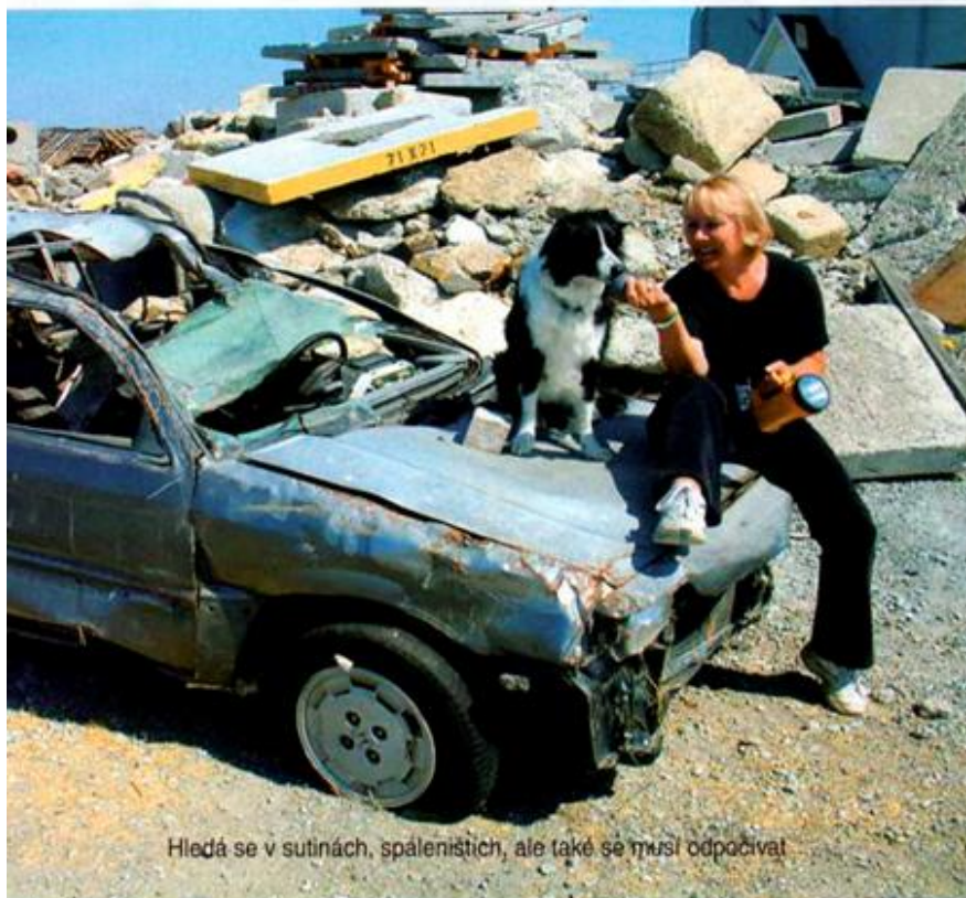
Hledá se v sutinách, spáleništích, ale také se musí odpočívat