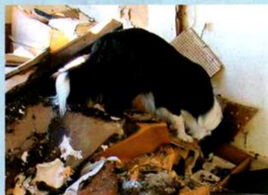
Hledá se často ve vysloveně odpudivých místech