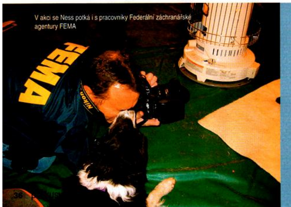
V akci se Ness potká i s pracovníky Federální záchranářské agentury FEMA.

Kromě záchranářské kynologie je vaše současná specialita hledání mrtvých osob či jejich pozůstatků (tzv. cadaver). Na cadaver jste učili psy hledat už tehdy?