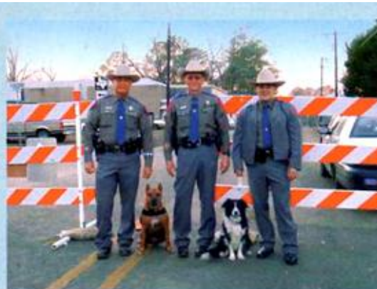
Policisté mají práci psích kolegů v úctě

NASA je instituce, která podniká lety do vesmíru, testuje letadla a uskutečňuje další, potencionálně nebezpečné lety. Proto má i zásahovou jednotku pro případ neštěstí. Navíc jedna z našich kolegyň v NASA pracuje právě jako koordinátorka záchranných týmů. Takový tým, tedy například ten náš, má asi 67 lidí. Jsou v něm lékaři, technici, statici, záchranáři, psi záchranáři, hasiči a další specialisté. Jsem také členkou federálního záchranného týmu California Task Force 3, což je samozřejmě úplně jiná instituce, která formálně nemá s NASA týmem nic společného. Je ale pravda, že se tyto týmy personálně často překrývají.