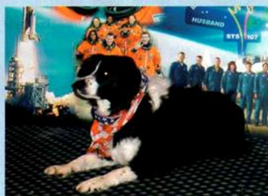
Pátrání po posádce raketoplánu bylo věnováno velké úsilí