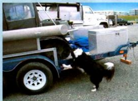
Kdykoliv pes pracuje, musí být maximálně soustředěný